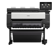
imagePROGRAF TX-3100 MFP Z36