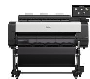
imagePROGRAF TX-4100 MFP Z36